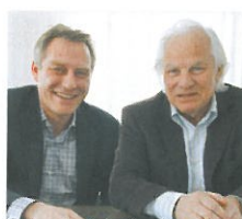
DI Joachim Alge/DI Günter Schertler

Bauherr: Wohnbauselbsthilfe Vorarlberg Architektur: Dietrich | Untertrifaller Wohnanlage Ulmer Areal Dornbirn, 2009