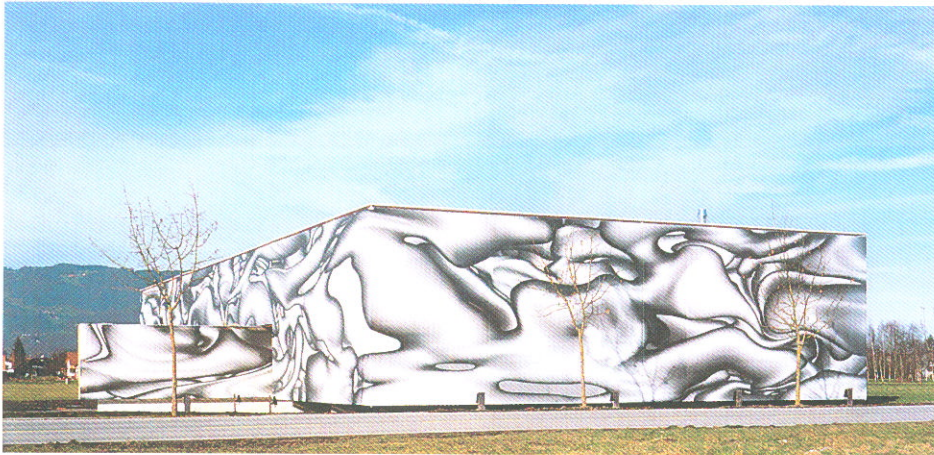
Walch's Event Catering, Lustenau, Architekt: Dietrich Untertrifaller, Künstler: Peter Kogler