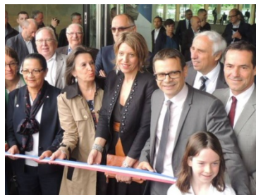
Eröffnung der Sporthalle in Longvic (F) Complexe sportif V. Pecqueux-Rolland