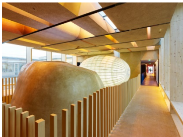
Nominierung des OMICRON Campus World Architectural Festival 2016 Berlin

www.worldarchitecturefestival.com/office