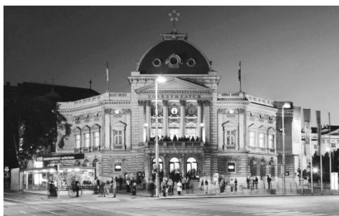
Volkstheater Wien - Kontext

Auch im Besucherteil werden Räumlichkeiten neu organisiert. Durch diese Neuordnung wird der Rote Salon eigenständig bespielbar und schafft so einem attraktiven Theater Platz. Im Außenbereich bietet der publikumswirksame Schanigarten mit mobiler Bar eine zusätzliche Attraktion. Als Abschluss des Vorhabens wird die gesamte Fassade des Theatergebäudes gereinigt und saniert. Die Fertigstellung ist für den Sommer 2019 geplant.