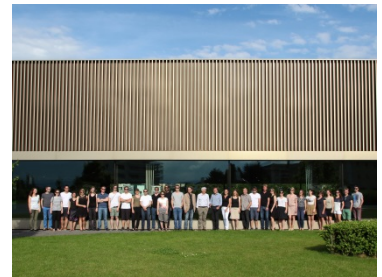
Jobangebote in Bregenz und Wien