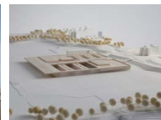
Sport Campus München